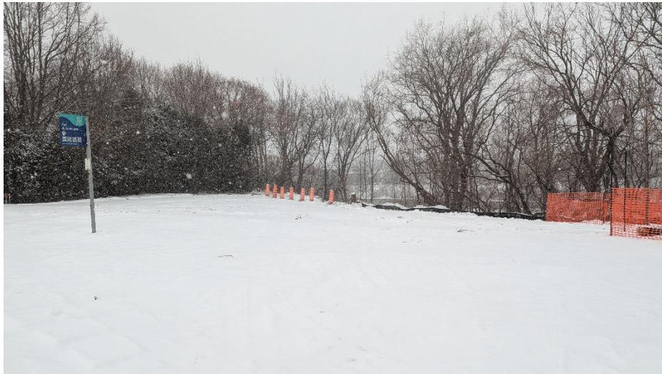
Parc de la Métairie, secteur La Providence

Saint-Hyacinthe, le 29 janvier 2025 – Cette semaine, la Ville de Saint-Hyacinthe a débuté la première phase du plus important projet de l'année inscrit à son Plan quinquennal d'immobilisations (PQI) 2025. Ce chantier ambitieux vise principalement à moderniser les infrastructures souterraines par le remplacement des conduites d'aqueduc actuelles par de nouvelles de plus grande capacité, ainsi que par la construction de réseaux sanitaire et pluvial, qui viendront remplacer les conduites d'égout combiné dans une partie du secteur La Providence.