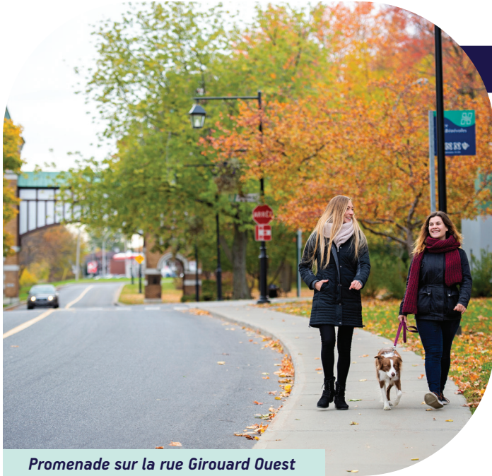
Promenade sur la rue Girouard Ouest