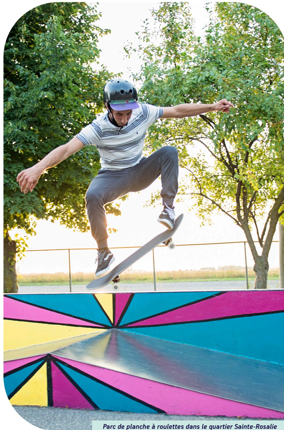
Parc de planche à roulettes dans le quartier Sainte-Rosalie