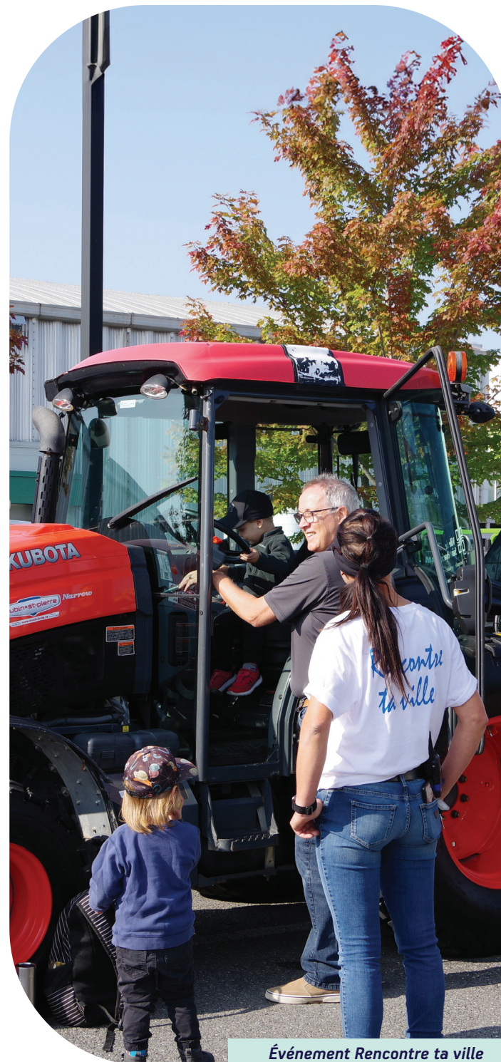
Événement Rencontre ta ville

La Ville de Saint-Hyacinthe tient également à remercier la firme « Institut du Nouveau Monde » pour sa contribution à la soirée de consultation et la firme Picbois Coop « Coopérative en aménagement et développement territorial » pour la réalisation du sondage auprès des citoyens.