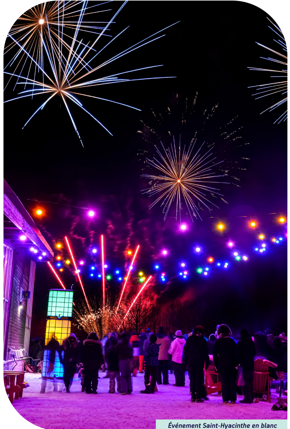
Événement Saint-Hyacinthe en blanc

En 2024, la Ville procède à une refonte de sa Politique citoyenne considérant que les changements sociodémographiques ont un impact sur les besoins, attentes et comportements de la population. La Ville maintient le désir de regrouper l'ensemble des secteurs d'activités du loisir, du sport, de la culture et de la vie communautaire sous une seule politique «parapluie», dite «Politique citoyenne», dans le but de favoriser la collaboration interservices et surtout pour s'assurer de fournir des réponses à l'ensemble de la population maskoutaine.