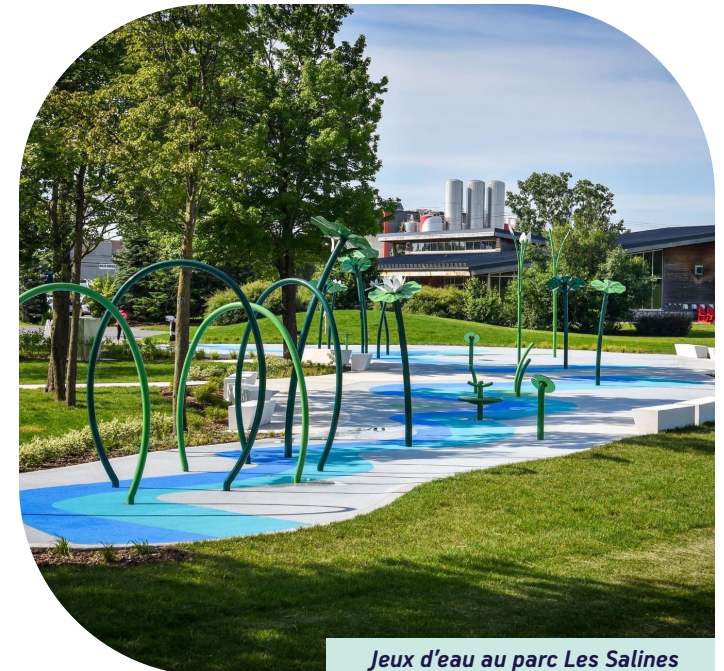
Jeux d'eau au parc Les Salines

La Ville s'engage à maintenir des efforts constants pour offrir aux citoyens un cadre de vie sécuritaire, aussi bien dans les lieux publics et les infrastructures qu'elle met à leur disposition, que dans leurs déplacements.