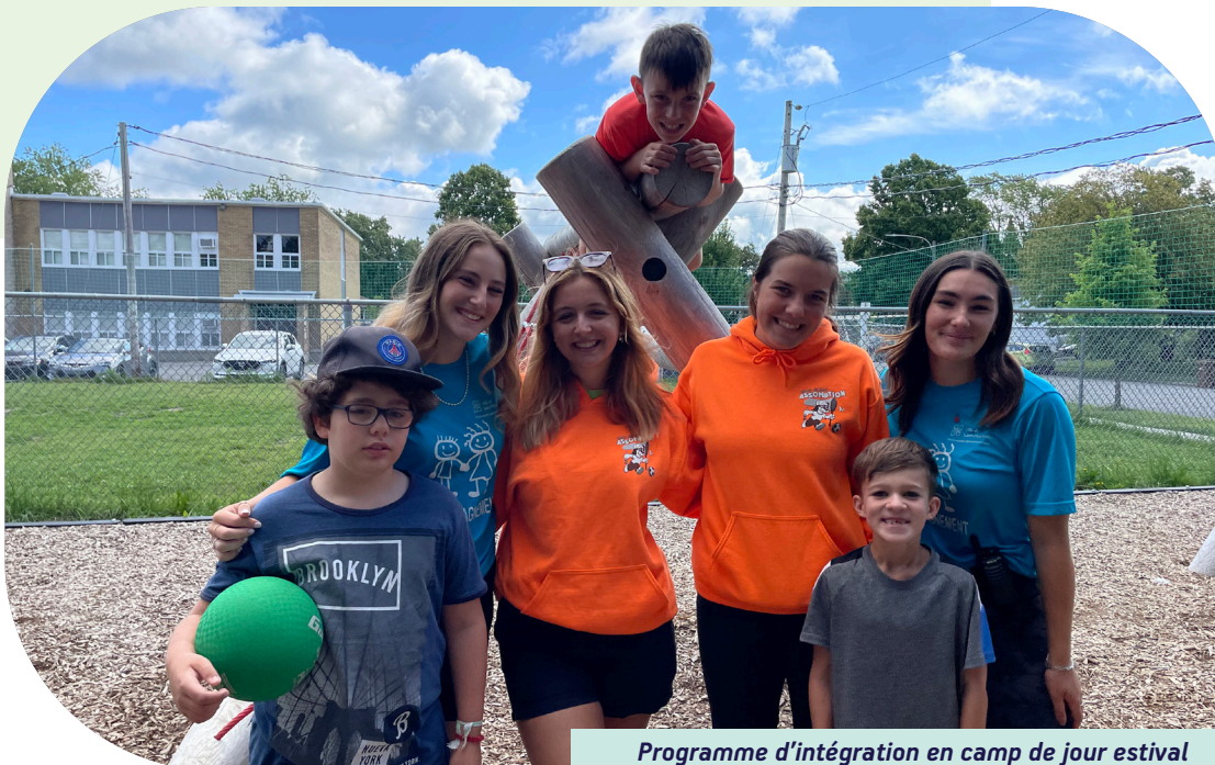
Programme d'intégration en camp de jour estival