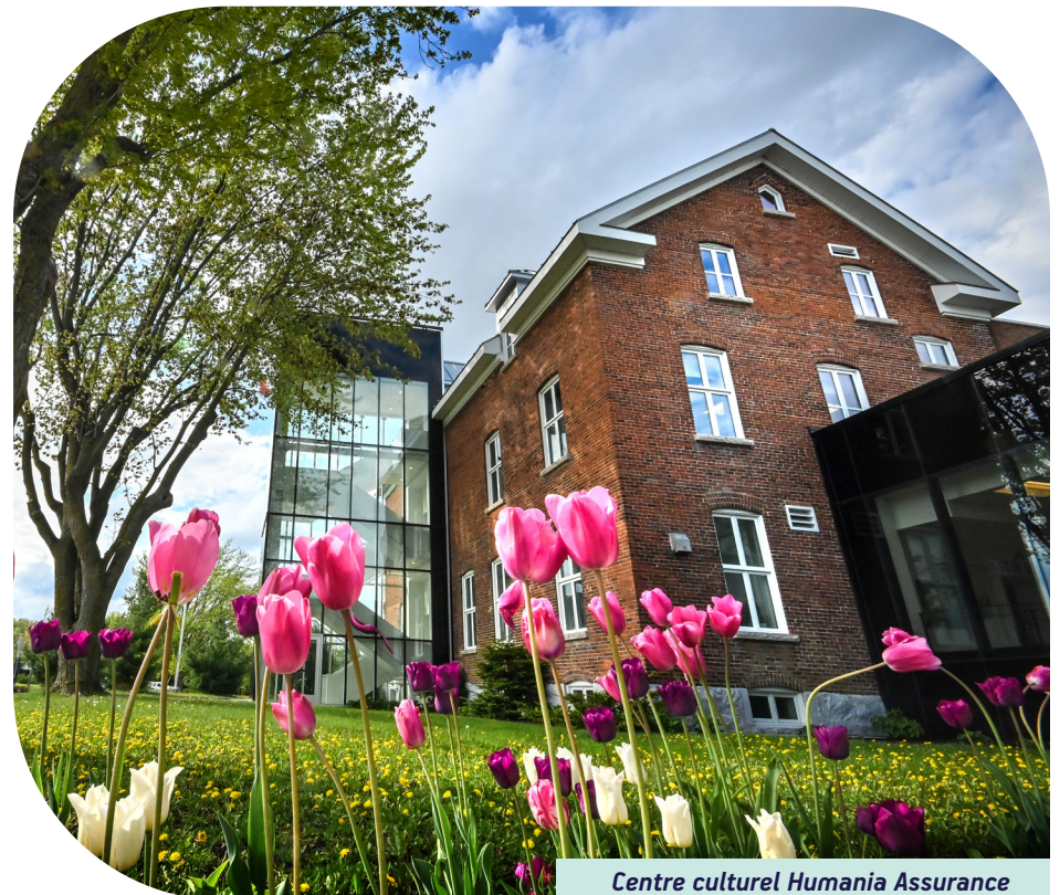
Centre culturel Humania Assurance

La Ville s'engage à reconnaître le droit à la pleine participation sociale pour tous, en tenant compte des besoins particuliers de certains individus ou de certains groupes. Elle s'engage également à tenir compte de la diversité des points de vue et de la situation de vulnérabilité de certaines personnes dont la participation sociale est limitée.