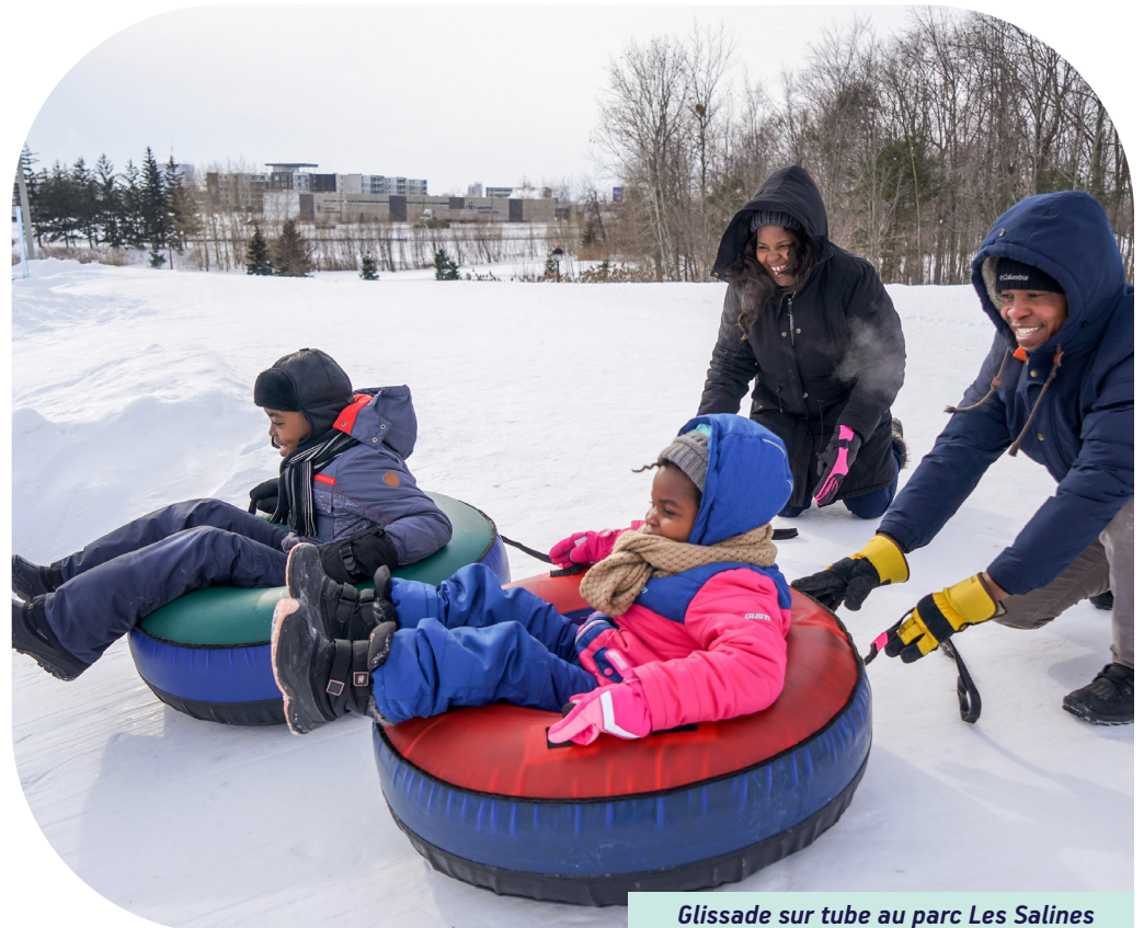
Glissade sur tube au parc Les Salines

Pour y répondre, la préservation de l'environnement et l'adaptation climatique devront être au cœur des décisions et des orientations municipales.