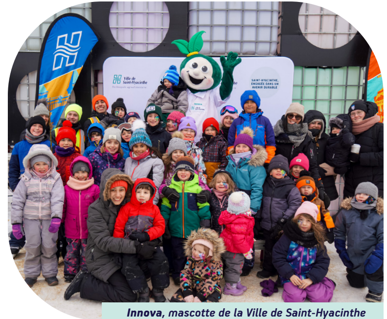
Innova, mascotte de la Ville de Saint-Hyacinthe