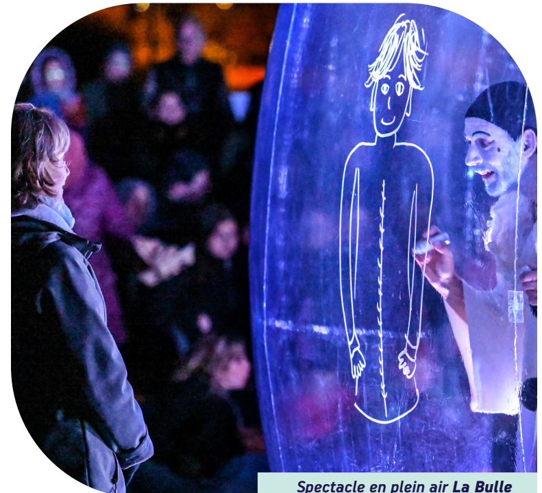
Spectacle en plein air La Bulle