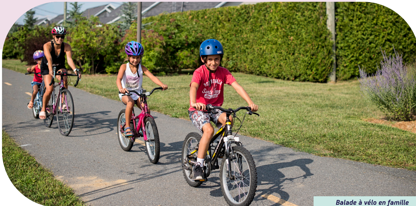
Balade à vélo en famille