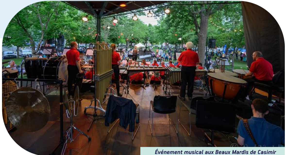
Événement musical aux Beaux Mardis de Casimir