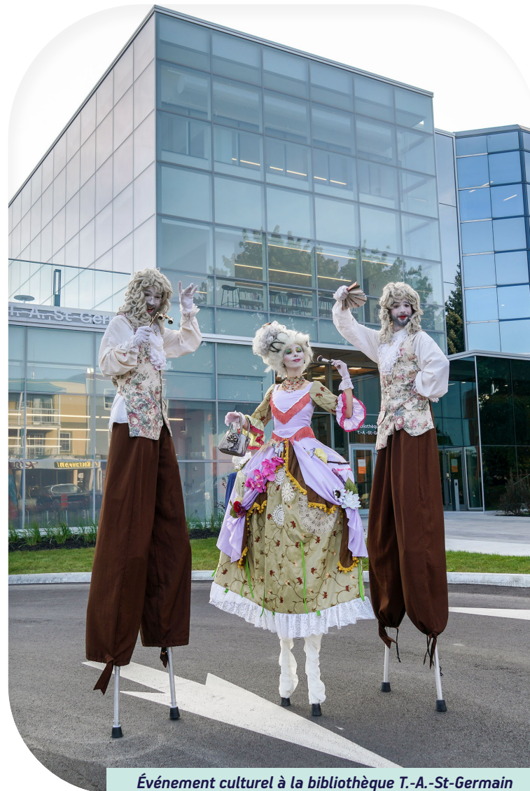
Événement culturel à la bibliothèque T.-A.-St-Germain

Pour y répondre, les milieux de vie devront favoriser une mixité sociale adéquatement intégrée aux projets de développement.